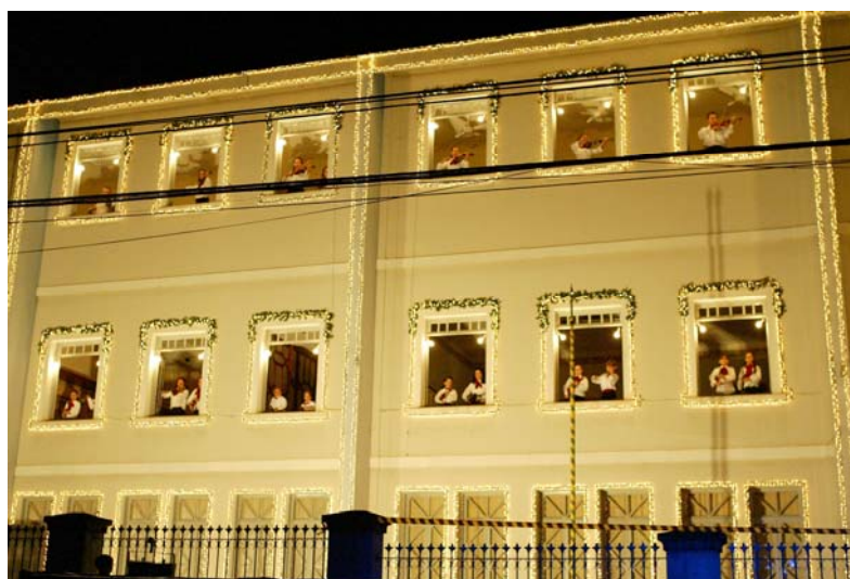
Apresentação dos alunos de violino