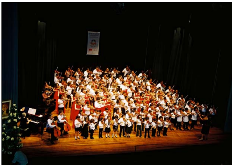
Apresentação do Grupo Buffalo Suzuki Strings com alunos de violino do Brasil – Teatro Ouro Verde 2003

O Colégio Mãe de Deus continua investindo em projetos que integram tanto o social, cultural e o educacional. No ano de 2003 ,com o patrocínio do PROMIC trouxe a Londrina, também pela primeira vez o Grupo de cordas “Buffalo Suzuki Strings” do estado de Nova York – USA, atingindo um número de aproximadamente 170 alunos e um público de mais de 1 mil pessoas assistindo ao Concerto.