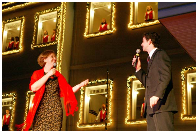
Apresentação de solos com o Coro da UEL (Universidade Estadual de Londrina)