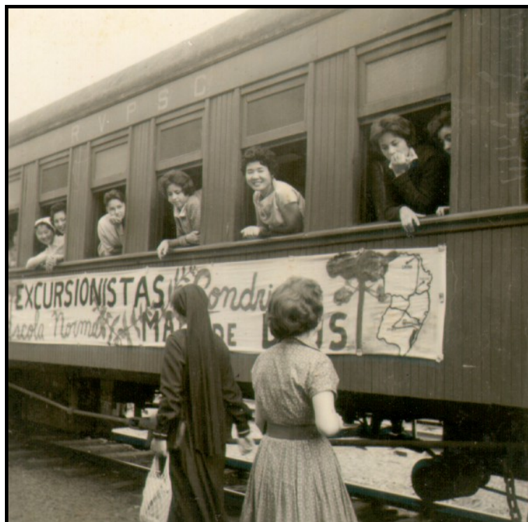
Excursão à região sul do Brasil feita pelas normalistas

Os primeiros tempos foram difíceis, devido à escassez de professores licenciados. A própria Irmã Maria Dorotéia precisou assumir algumas disciplinas para as quais não havia professores qualificados. A Faculdade de Filosofia, Ciências e Letras de Londrina foi criada em 1956, portanto, o Colégio Mãe de Deus iniciou a tarefa de formar professores num período em que as circunstâncias eram bastante desfavoráveis. Aos poucos, a carência de professores foi amenizada.