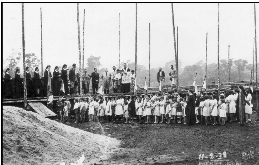
Lançamento da pedra fundamental em 11 de fevereiro de 1938