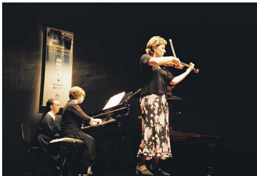
Concerto no Teatro Ouro Verde com a violinista Barbara Barber (USA) - 2004

Outro Projeto foi o Solos para Jovens Violinistas, apresentado pela primeira vez no Brasil, e promovido pelo Colégio e Instituto Superior de Educação Mãe de Deus. Este evento, realizado de 24 de outubro à 02 de novembro de 2004 em comemoração aos 30 anos do Método Suzuki no Brasil, colocou Londrina no cenário musical brasileiro e atraiu músicos do Brasil e do exterior.