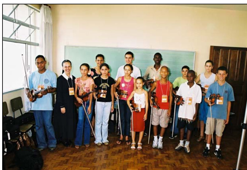
Crianças de um projeto social que participaram do Projeto- Colégio Mãe de Deus - 2004