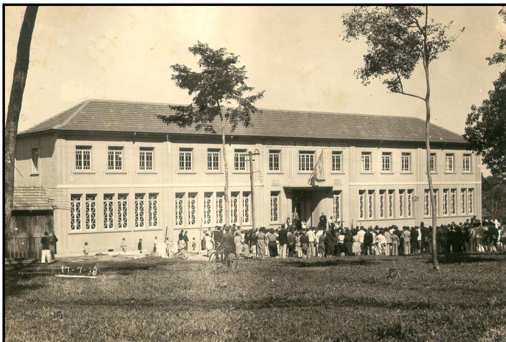
Bênção e inauguração da primeira ala do Colégio Mãe de Deus, no dia 17 de julho de 1938