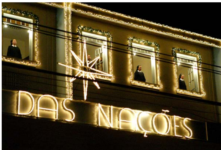
Abertura da Cantata pelas Irmãs de Maria

A apresentação já se tornou tradição no calendário londrinense e tem atraído caravanas de diversas cidades e estados. É uma vivência que congrega toda a comunidade. Neste ano de 2005 foram seis coros envolvidos, além da comunidade acadêmica. Alguns momentos deste evento estão registrados nas fotos abaixo.