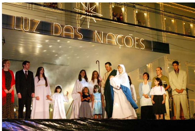
Final com mensagem para o Natal

O Colégio Mãe de Deus, embora seja portador de uma pedagogia moderna, à medida que o tempo passa, necessita de renovação, no sentido de ampliar seus cursos e projetos. Ele não pode se manter estático perante as constantes transformações da sociedade, bem como perante suas necessidades. Criaram-se novos cursos, como o ginásio, a escola normal, o Curso Normal Superior e como pioneira na área musical de Londrina, a Faculdade de Música. Muitos foram e são os desafios, contudo o Colégio, em quase 75 anos de existência, procurou sempre lutar por seu objetivo e à medida que o tempo passa, ele se aperfeiçoa, adaptando-se às mudanças da modernidade. Cada curso, em